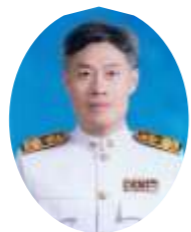
หัวหน้างานระบบสาธารณูปโภค กองกายภาพและสิ่งแวดล้อม ประธานกรรมการ