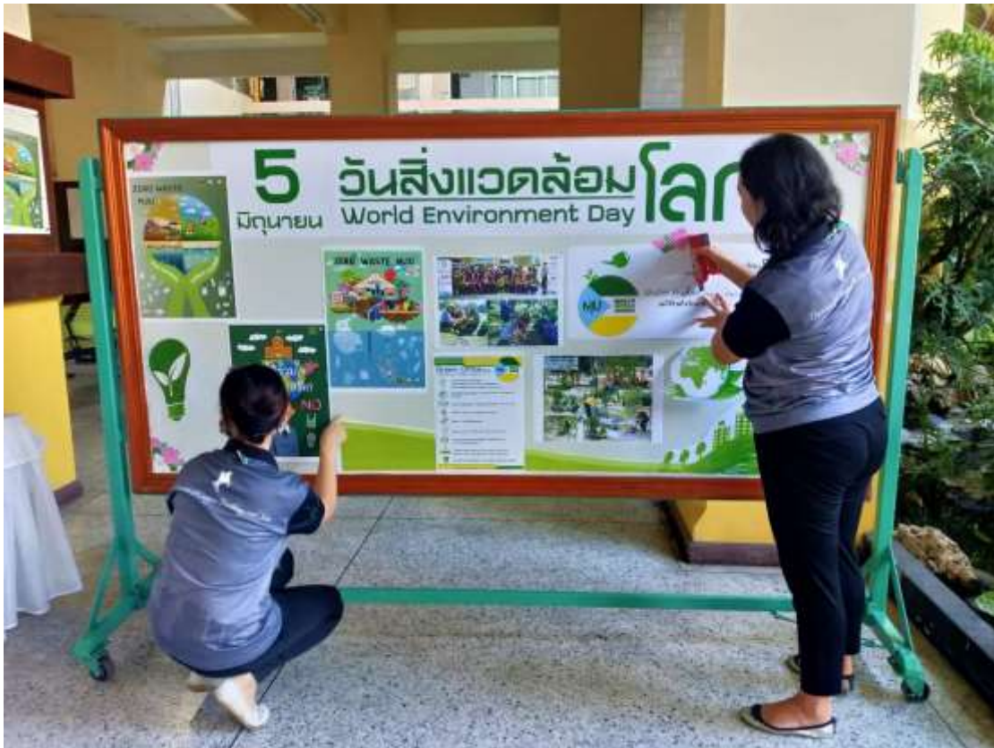
อบรมออนไลน์