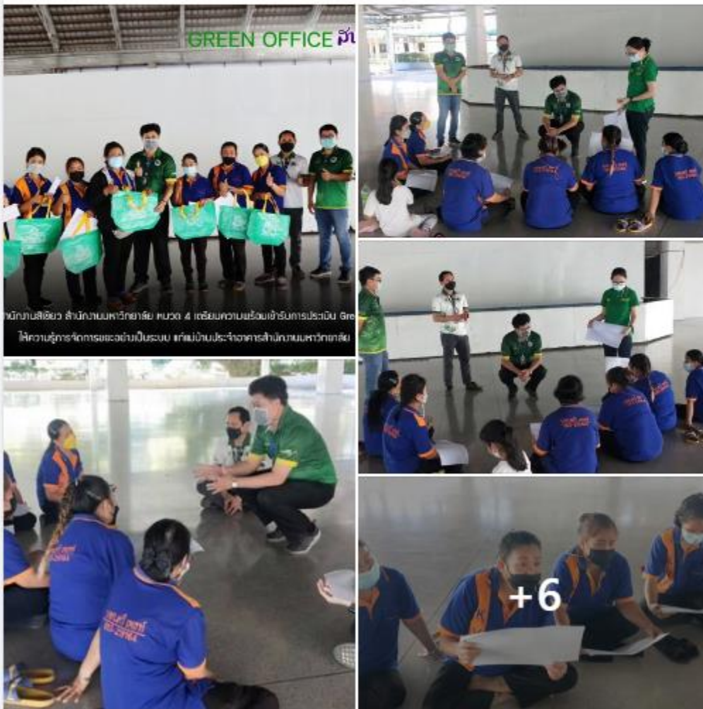
พนักงานสีเขียว สำนักงานมหาวิทยาลัย หมวด 4 เตรียมความพร้อมเข้ารับการประเมิน Green Office ให้ความรู้การจัดการขยะอย่างเป็นระบบ แก่แม่บ้านประจำอาคารสำนักงานมหาวิทยาลัย

📢 โปรโมทโพสต์นี้เพื่อเข้าถึงผู้คนมากขึ้นสูงสุดถึง 1953 คนหาก คุณใช้จ่าย ฿700